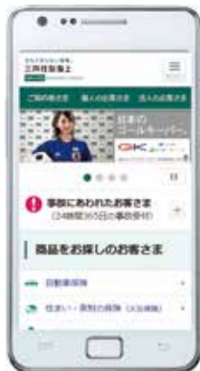
スマートフォン版

会社情報、商品・サービス、各種お手続き方法などのさまざまな情報を掲載しています。2015年7月には、「お客さまが迷わず情報にたどり着ける」をコンセプトにサイトを再構築したほか、スマートフォンやタブレットの普及にも対応した、利便性の高いサイトを提供しています。また、高齢者や障がい者に配慮したフォントや配色を導入し、視認性を高めています。