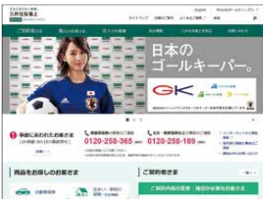
パソコン・タブレット版