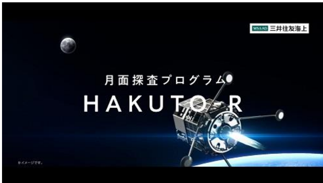
新テレビCM「HAKUTO-R 10年越しの想いを乗せ、月へ。」篇

MS&ADインシュアランスグループの三井住友海上火災保険株式会社（社長：船曳 真一郎）は、11月4日（金）から、民間月面探査プログラム「HAKUTO-R」のテレビCMを放送します。本CMの映像は、当社オフィシャルサイト内「宇宙保険特設コンテンツ」および三井住友海上公式YouTubeチャンネルでも公開します。