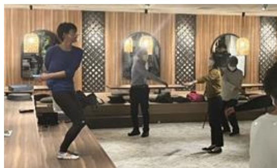
< 「社内ヨガレッスン」の様子 >