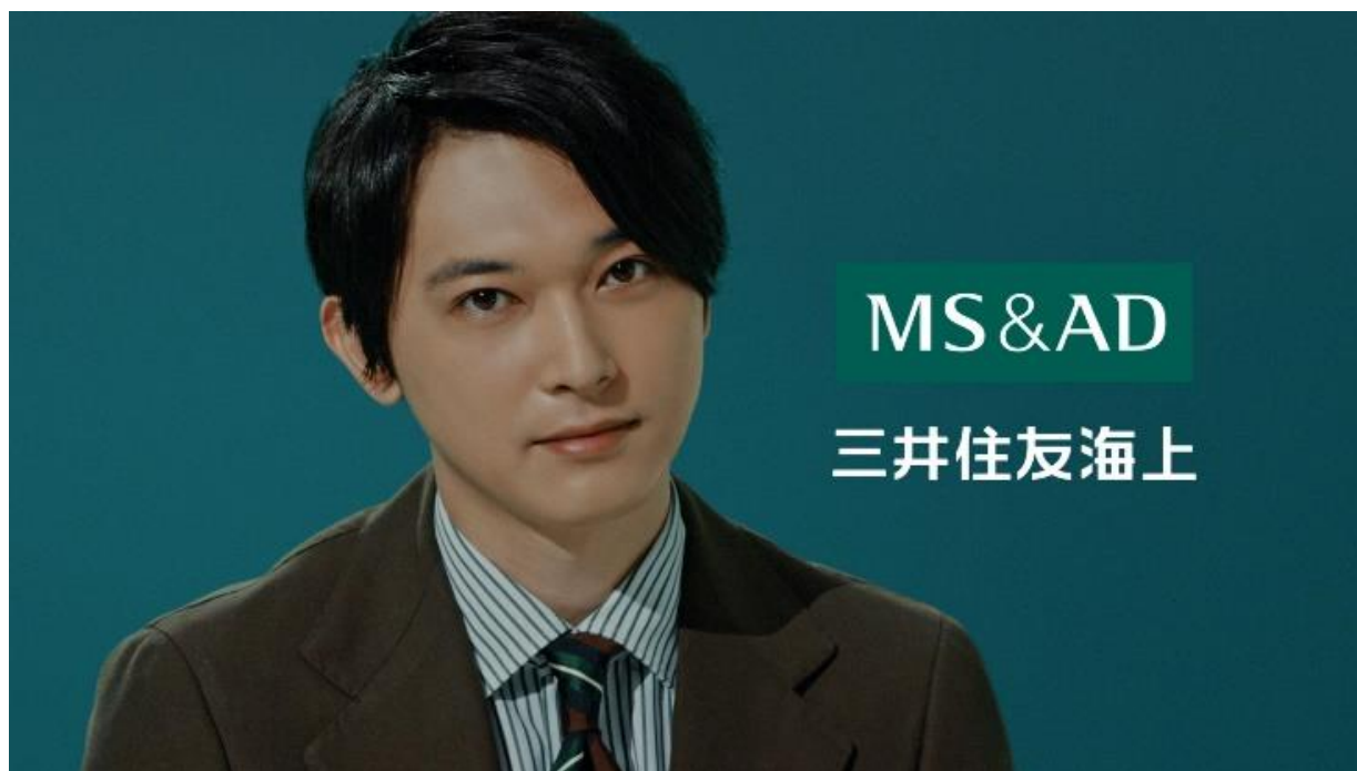
新テレビCM「プレドラ体験篇」

本CMの映像は、当社公式HP内特設コンテンツおよびYouTube公式チャンネルにおいても公開いたします。特設コンテンツでは、メイキング動画、WebCM用動画に加えて、「見守るクルマの保険（プレミアム ドラレコ型）」（略称プレドラ）の機能を分かりやすく紹介しています。