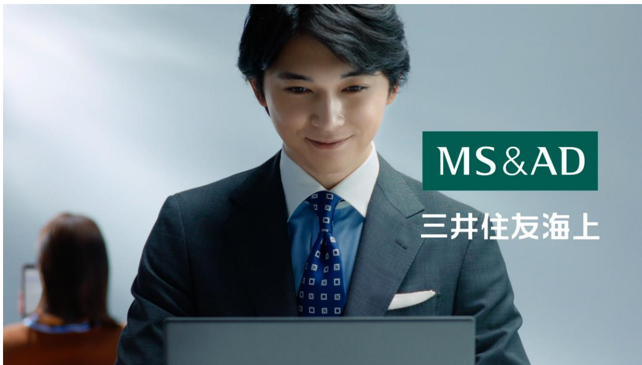
新テレビCM「MS1 Brain サプライズ篇」(60秒)

特設サイトでは、メイキング動画、WebCM用動画に加えて、ベストプラン提案型AI代理店システム「MS1 Brain」をイメージキャラクター(※)がわかりやすく解説しています。