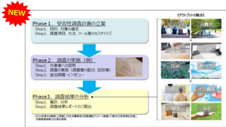
<アンケート調査サービスのイメージ>

自動運転車における実証実験事業の安定的な発展を目指し、リスク低減支援サービスの提供を開始します。本サービスは、専門的・客観的・多角的な視点から、リスクアセスメントをはじめ、リスク低減対策の検討および、安全管理体制の構築を支援するものです。その他にも、実証実験を実施する地域や関係者を対象に、自動運転車を活用したビジネスモデルに関する社会的受容性の評価を目的としたアンケート調査サービスの提供を開始します。調査にて得られた知見等を活用することで、今後のビジネスモデル構築の検討にご利用いただけます。