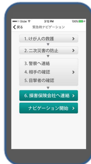
< 緊急時ナビ画面 >