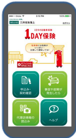
< 1DAY保険トップ画面 >

事故や故障・トラブルが起きてしまった場合に、対応方法をナビゲーションしてくれる「緊急時ナビ」機能を搭載しています。「何をすれば良いか分からない」という方でも、ナビゲーションに従って行動することで落ち着いたスムーズな対応が可能です。