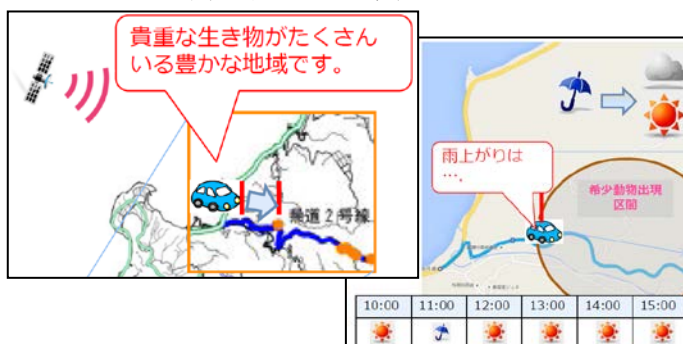
①動物の生活史、出没時間および天候による出没率に応じた音声アラート