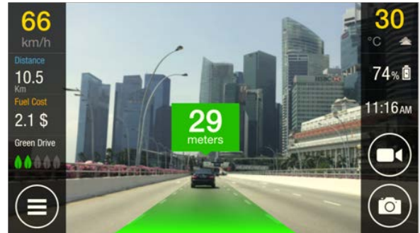
<アプリ起動中の画面イメージ (iOS 版)>

当社は、東南アジア地域では MSIG ブランドにてビジネスを展開しており（フィリピンでは BPI/MS）、MSIG のロゴをアプリアイコンの中にデザインしました。