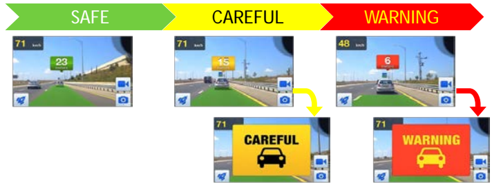
<車間距離アラート>

前方走行車との車間距離（または衝突危険までの秒数）をリアルタイムにタグ表示で“見える化”。距離に応じて、SAFE（安全）[緑色]—CAREFUL（注意）[黄色]—WARNING（警告）[赤色]と3段階でタグの色が変わります。さらに、CAREFUL と WARNING ではポップアップと音声による警告を行い、ドライバーに十分な車間距離での安全運転を促します。