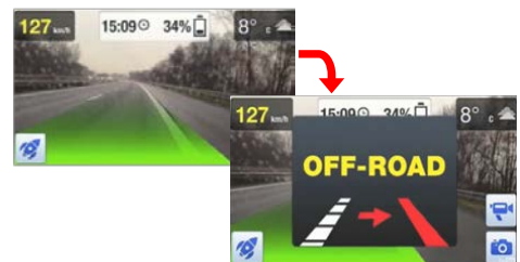
<車両逸脱アラート>

高速道路等で走行車線からはみ出した時にドライバーに警告音でお知らせします。（60km 以上の走行時のみ）