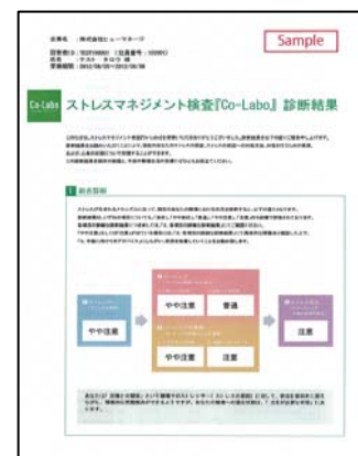
<検査結果レポートのイメージ>