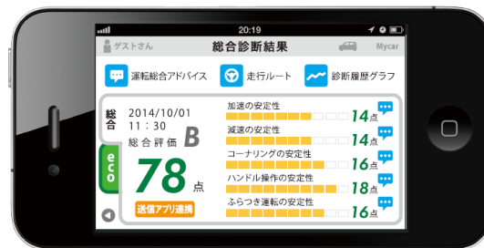
スマ保『運転力』診断 結果画面