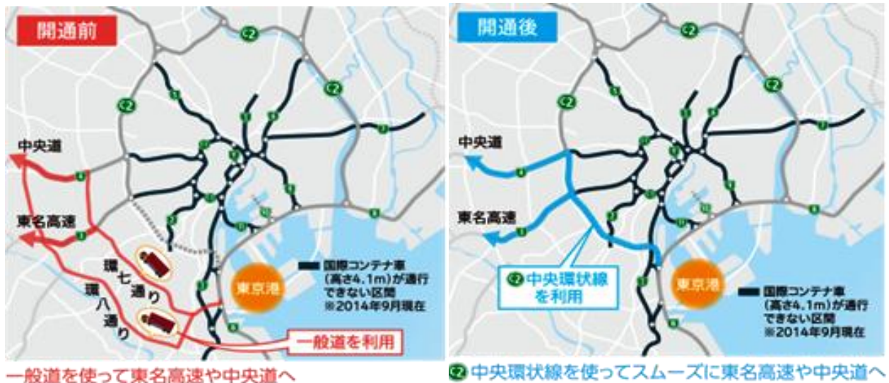
一般道を使って東名高速や中央道へ

今回の中央環状線の全線開通により、一般道を通らずに国際海上コンテナを東名、中央道などへ輸送することが可能となり、迂回や積み替えなどにより発生していたリードタイムの短縮やコストの削減が期待されます。