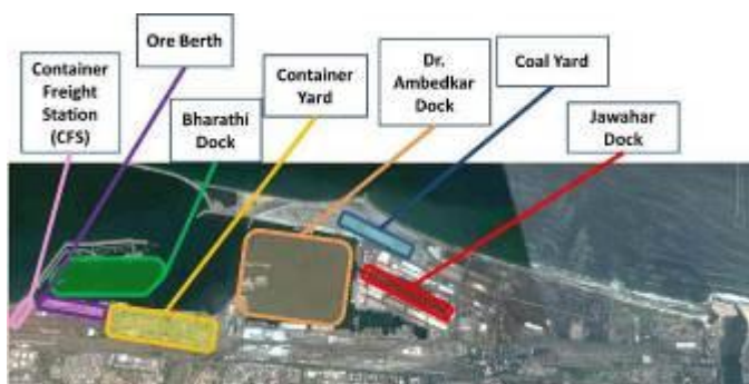
チェンナイ港上空図