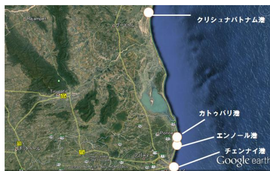
チェンナイ近郊各港湾の位置関係

※TEU: Twenty-foot Equivalent Units の略。20 フィートコンテナを 1 単位とした、貨物量を表す単位。