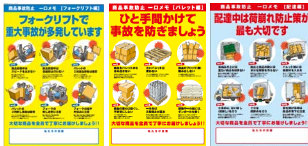
フォークリフト編