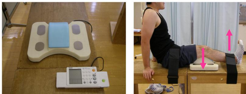
図 1. 下肢筋力測定訓練器（アルケア社 ロコモスキャン）

上述した成果は英語論文雑誌 Arthritis Rheumatology にて発表するとともに、2015 年度日本整形外科学会のほか、EULAR、IOF などの国際学会でも発表する。