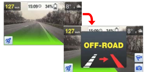
<車両逸脱アラート>

高速道路等で走行車線からはみ出した時にドライバーに警告音でお知らせします。（60km 以上の走行時のみ）