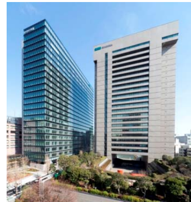
駿河台新館（左）と駿河台ビル（右）

総敷地面積17,387㎡のうち、43.4%にあたる7,543㎡を緑化しています。三井住友海上駿河台ビル低層部分の屋上には緑地面積2,614㎡におよぶ庭園があります。