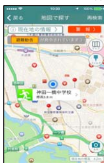
<避難勧告通知画面>