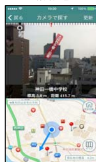
<カメラで探す画面>