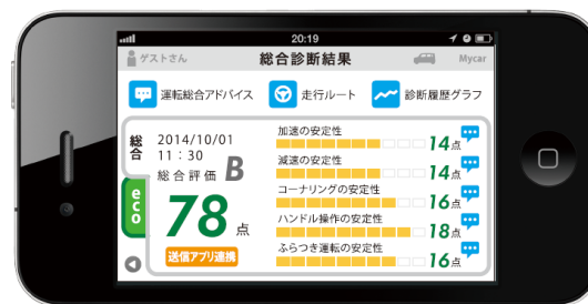
スマ保『運転力』診断 結果画面