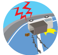
輸送用具の転覆・横転

★ 印のものは、引受方式が「売上高包括方式」「車両特定方式(包括方式)」の場合のみ仮置中として補償します。ただし仮置場所ごとに到着後1か月の日数制限があります。1か月を超える保管が発生する場合には、取扱代理店または当社までお問い合わせください。