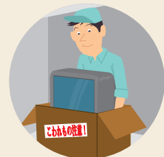
梱包・開梱作業中★