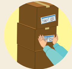
タグ貼り等の流通加工中★