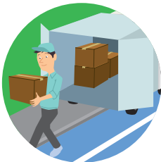
積み込み・荷卸し中