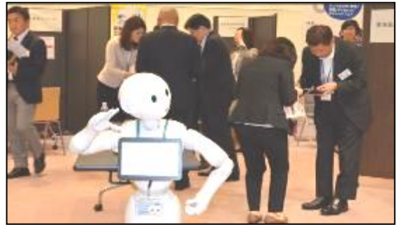
(写真：ペッパー君も個別相談会を盛り上げていました)

次年度以降も、さらに様々なセミナー企画を予定していますので、皆さまの海外進出や、ビジネスの発展へお役立ていただけましたら幸いです。