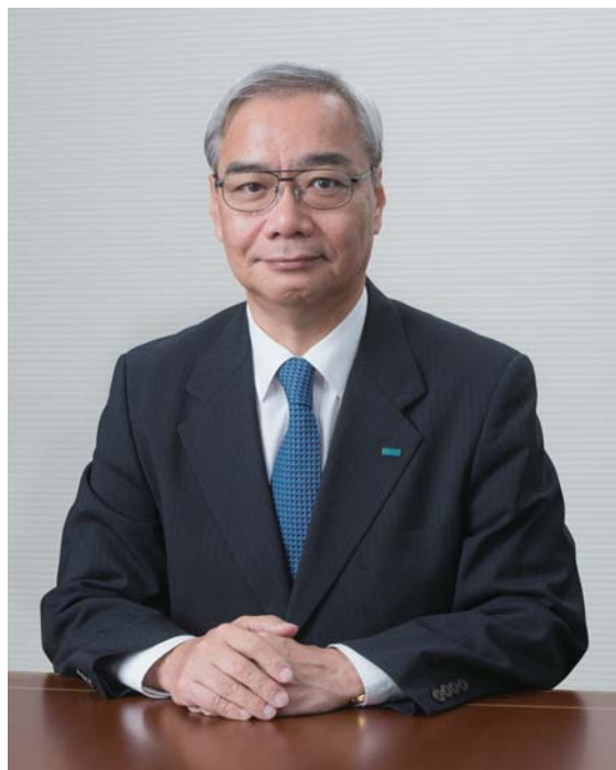
三井住友海上火災保険株式会社

今後もMS&ADインシュアランスグループの一員として、「世界トップ水準の保険・金融グループ」の創造を目指すとともに、国民生活と経済を支える損害保険事業の担い手として、社会に貢献してまいります。